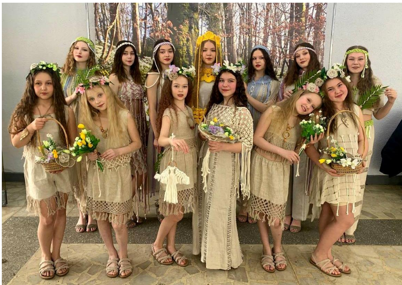
Фото творческой коллекции