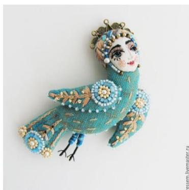
Рисунок 1. Брошь «Птица-Дева» Автор Мария Кнутова.

Текстильная брошь выполненная из льна, украшена вышивкой, речным жемчугом, бисером, стеклярусом.