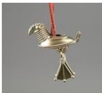
Рисунок 2. Подвеска «Утица». Автор: Зорин П.М., г. Глазов

Текстильная брошь выполненная из льна, украшена вышивкой, речным жемчугом, бисером, стеклярусом.