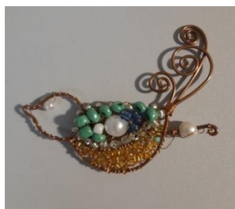
Рисунок 2. Брошь «Птица» Автор: Дзюина Анна, п.Игра

Бронзовое украшение по мотивам находок, найденных на памятнике чепецкой археологической культуры - городище Иднакар.