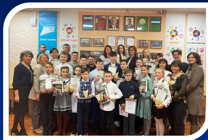
Районный конкурс технологических научно-исследовательских проектов, 2024 г.