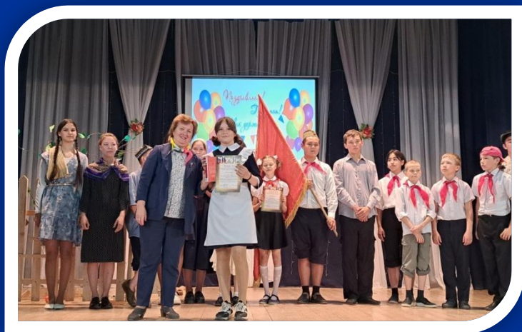
Районный фестиваль детских общественных организаций, 2023 г.