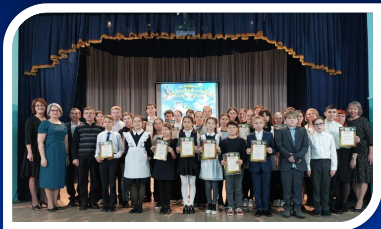
Районная конференция учебно-исследовательских работ учащихся, 2024 г.