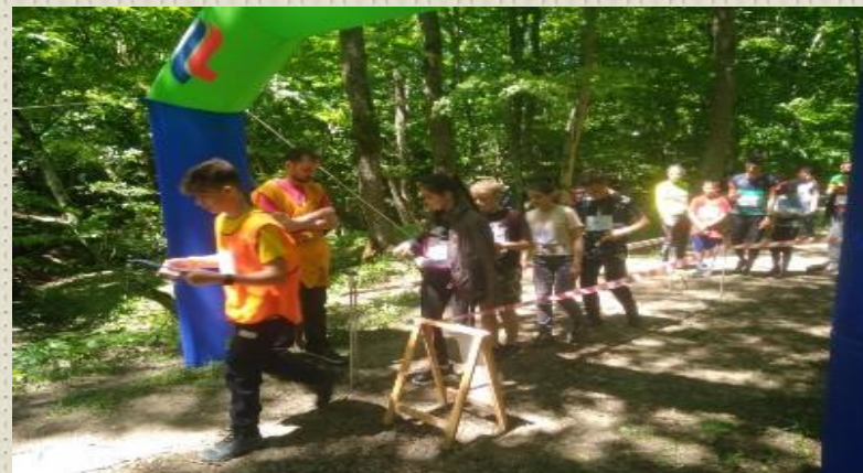
Краевые соревнования по спортивному ориентированию "Кубанский азимут"