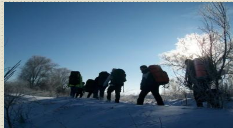
Муниципальный этап краевого похода «48 часов»