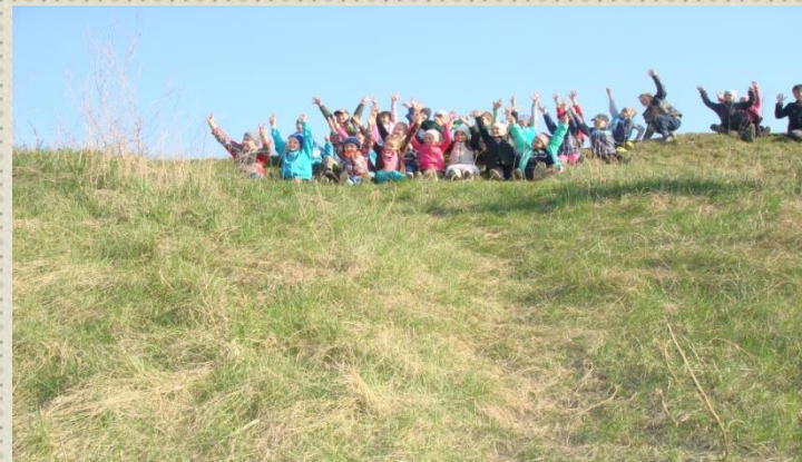
Скифские курганы в ст. Архангельской