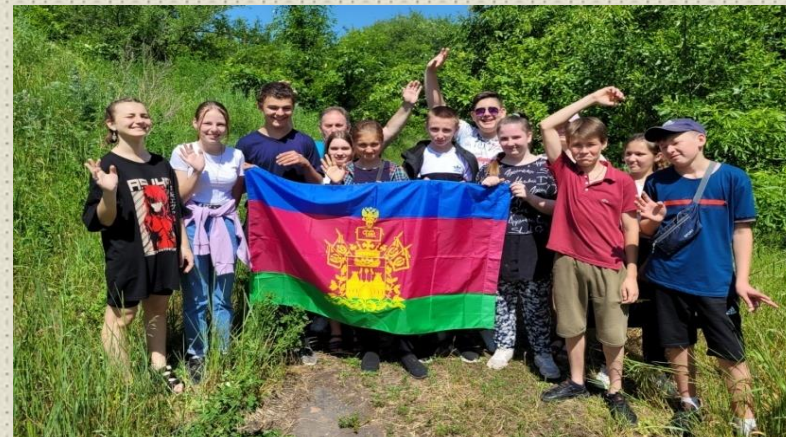
Краевая Акция флешмоб «Мы – дети Кубани» в честь празднования международного Дня защиты детей