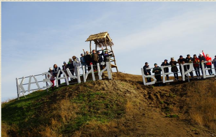
Комплекс «Казачий берег»