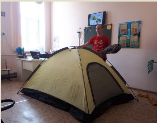
Мастер-класс «Образовательный туристический маршрут «По местам боевой славы Тихорецкого района»