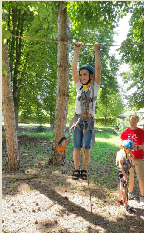
Мастер-класс для воспитанников 7-12 лет лагеря с дневным пребыванием «Город мастеров» на базе МБОУ СОШ № 18 п. Паркового с использованием туристского оборудования