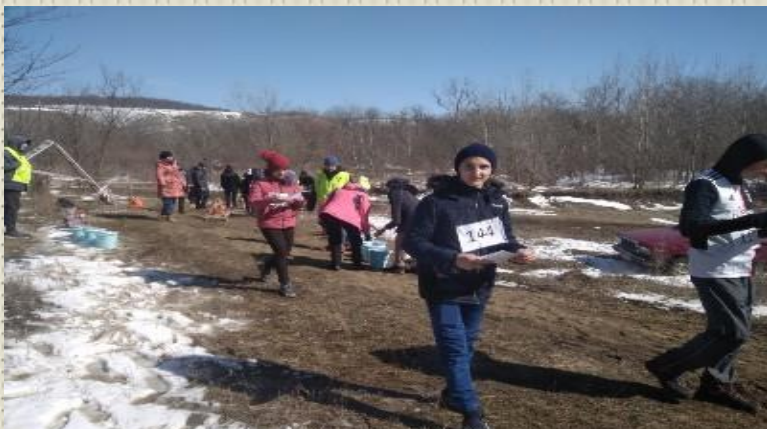
Первенство по спортивному ориентированию «Армавир – 2021»