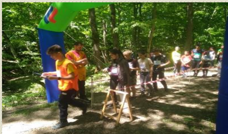
Краевые соревнования по спортивному ориентированию "Кубанский азимут"