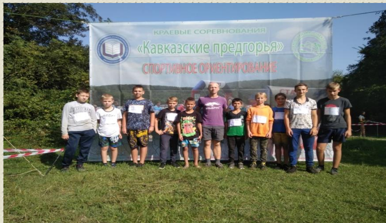
Краевые соревнования по спортивному ориентированию «Кавказские предгорья»