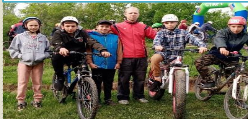
Кубок центра туризма и экскурсий Краснодарского края на велосипедных дистанциях (г. Апшеронск)