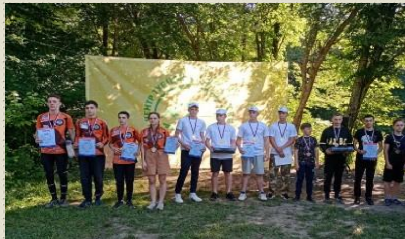
Краевые соревнования «Школа безопасности» (ст. Ставропольская Севрского района). 3 место в пожарной эстафете, 4 место в поисковых работах (ориентирование)