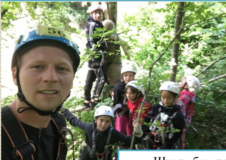
Школа безопасности – 2023»