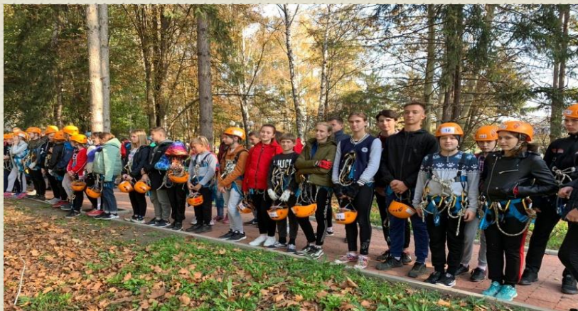
Районная спартакиада учащихся ОО МО Тихорецкий район по спортивному туризму