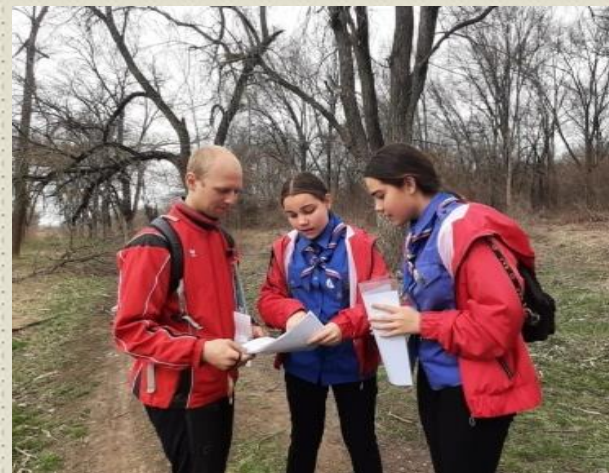
Мастер-класс по спортивному ориентированию для Братства православных следопытов имени свщмуч. Иоанна Пригоровского