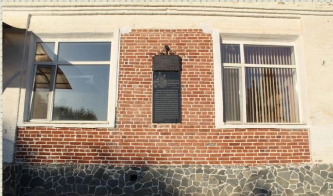
здание СОШ № 33, построенное в 1937 году из разрушенного храма Александра Невского