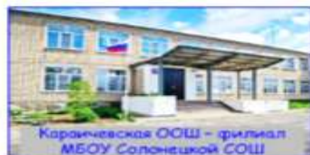
Караичевская ООШ - филиал МБОУ Солонецкой СОШ