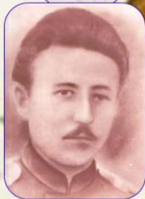
Макаренко Афанасий Фомич