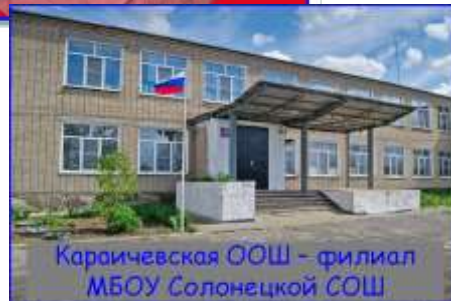
Каричевская ООШ - филиал МБОУ Солонецкой СОШ