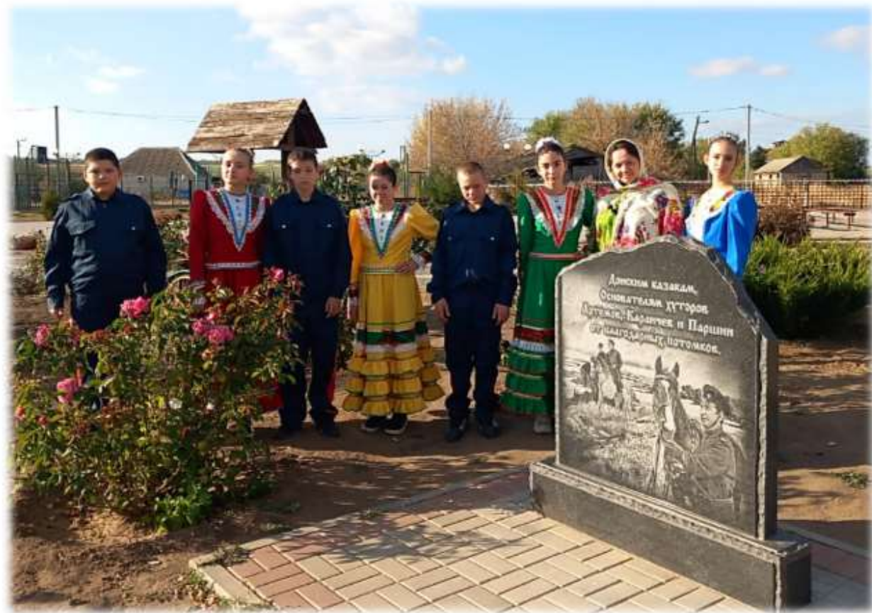
Команда «Платовцы – удалецъ» у памятного знака – 2023 г.