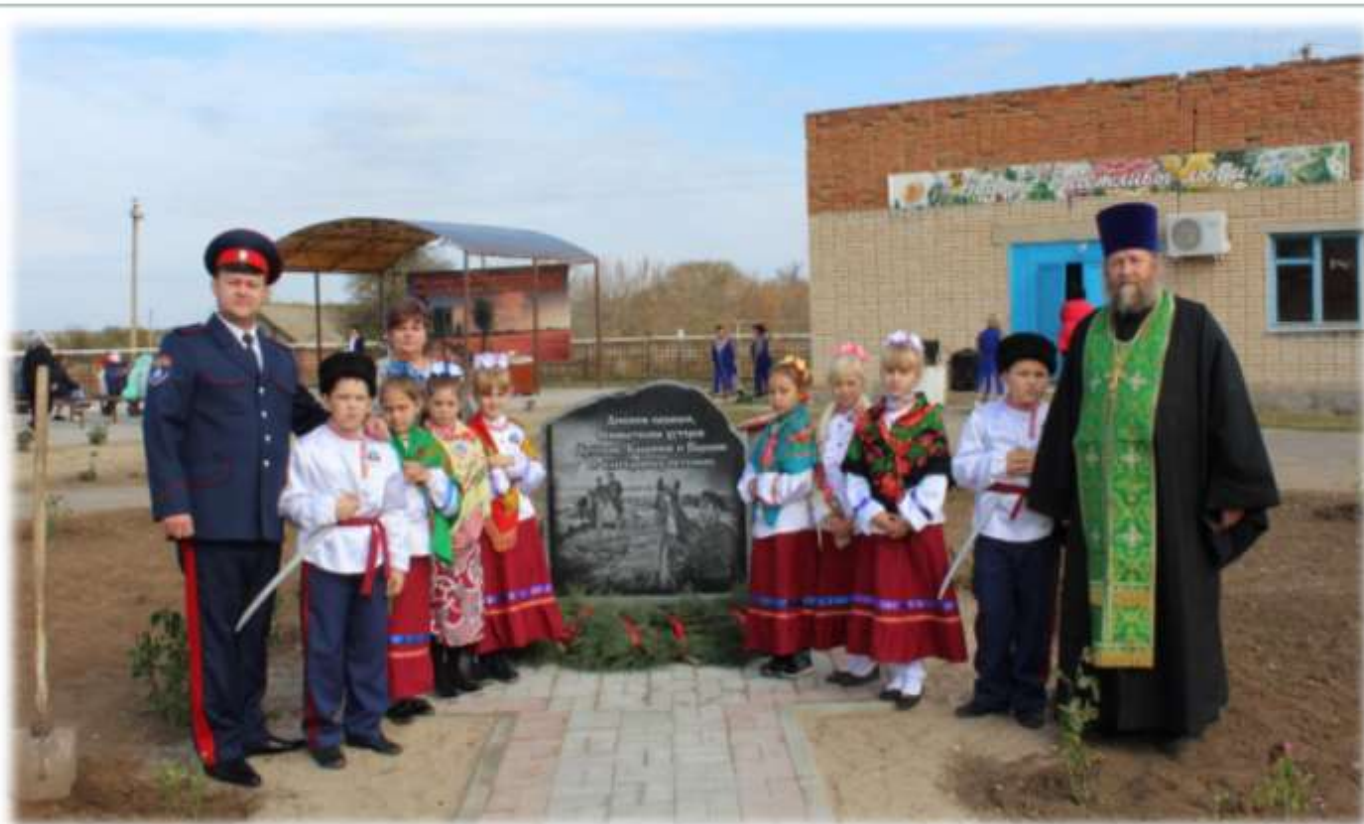
2019 год – открытие памятного знака «Донским казакам, основателям хуторов Артемов, Каранчев и Паршин от благодарных потомков».