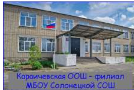
Карачевская ООШ – филиал МБОУ Солонецкой СОШ

Наш девиз: Не отступать! До конца всегда стоять! Себе – честь, Родине – слава!