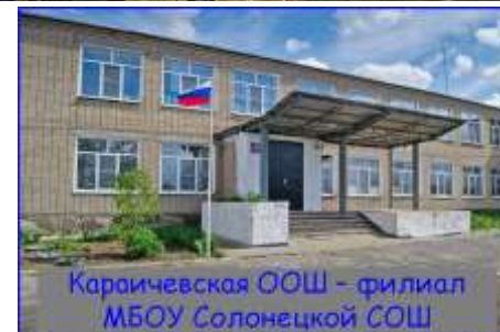
Караичевская ООШ – филиал МБОУ Солонецкой СОШ

Наш девиз: Не отступать! До конца всегда стоять! Себе – честь, Родине – слава!