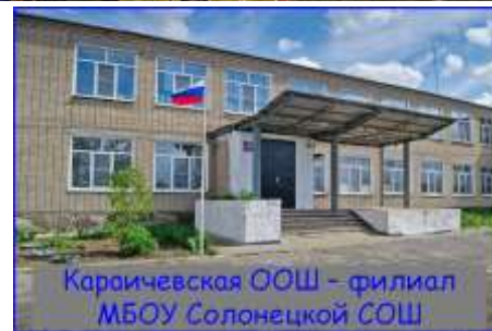
Караичевская ООШ – филиал МБОУ Солонецкой СОШ

Наш девиз: Не отступать! До конца всегда стоять! Себе – честь, Родине – слава!