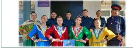
Команда «Платовцы - удальцы»

Всеволокское войско Донское, Обливский юрт, Ростовская область, Караичевская ООШ - филиал МБОУ Солонецкой СОШ им. Героя Российской Федерации Шаймуратова М. М.