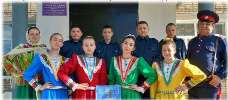
Команда «Платовцы - удальцы»

Всевеликое войско Донское, Обливский юрт, Ростовская область, Караичевская ООШ - филиал МБОУ Солонецкой СОШ им. Героя Российской Федерации Шаймуратова М. М.