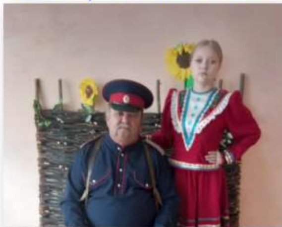
Фото из архива команды. 2023г.

“Воспитание казака — война” - фотоколлаж команды «Платовцы – удальцы».