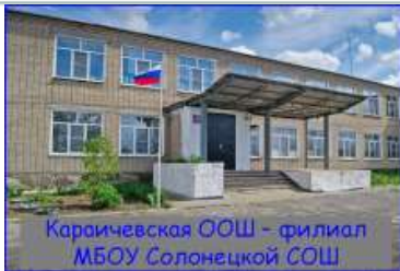
Караичевская ООШ – филиал МБОУ Солонецкой СОШ