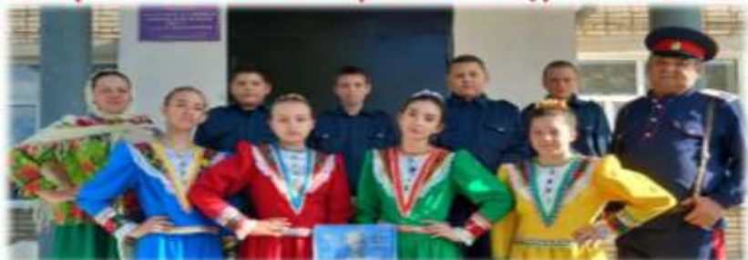
Команда «Платовцы - удальцы»

Всевеликое войско Донское, Обливский юрт, Ростовская область, Караичевская ООШ - филиал МБОУ Солонецкой СОШ им. Героя Российской Федерации Шаймуратова М. М.